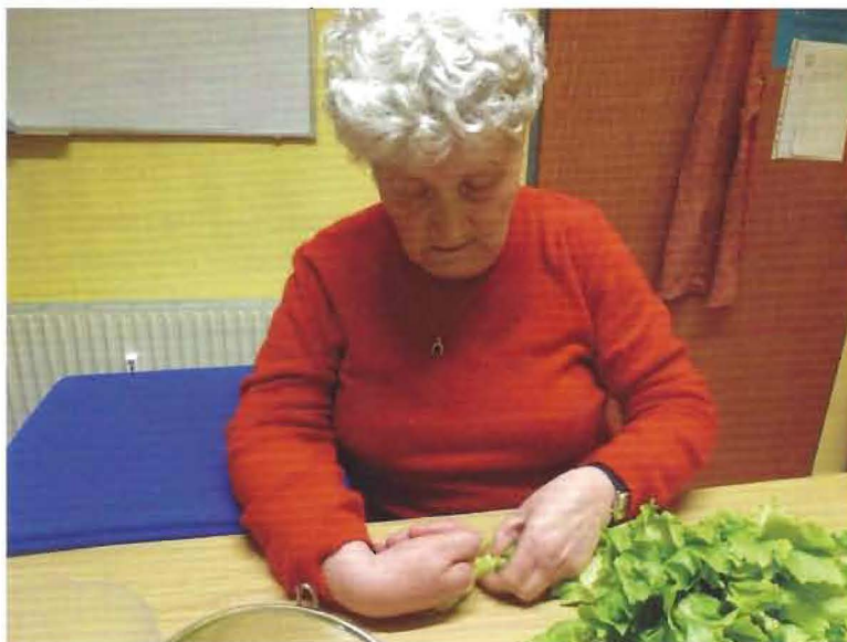
Ergotherapeutische Übung alltäglicher Aufgaben

Deswegen danken wir an dieser Stelle ganz besonders dem ROTARY CLUB PERCHTOLDS DORF für seine großartige Unterstützung!